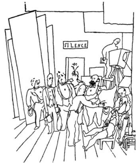
Jean Cocteau, Nijinsky dans les coulisses à la fin du Spectre de la rose (Dessins Paris, Stock, 1924)