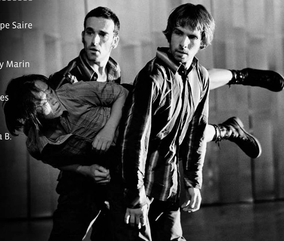
Sang d'encre

Théâtre Forum Meyrin / T. 022 989 34 34 / www.forum-meyrin.ch Service culturel Migros / T. 022 319 61 11 / www.culturel-migros-geneve.ch Stand Info Balxert / Migros Nyon-La Combe