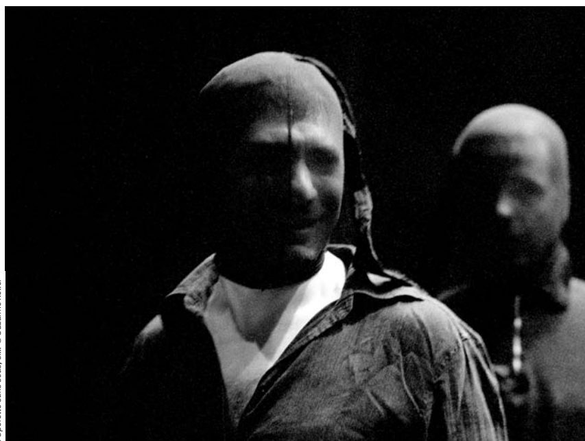
L'Opérette sans sous, si...